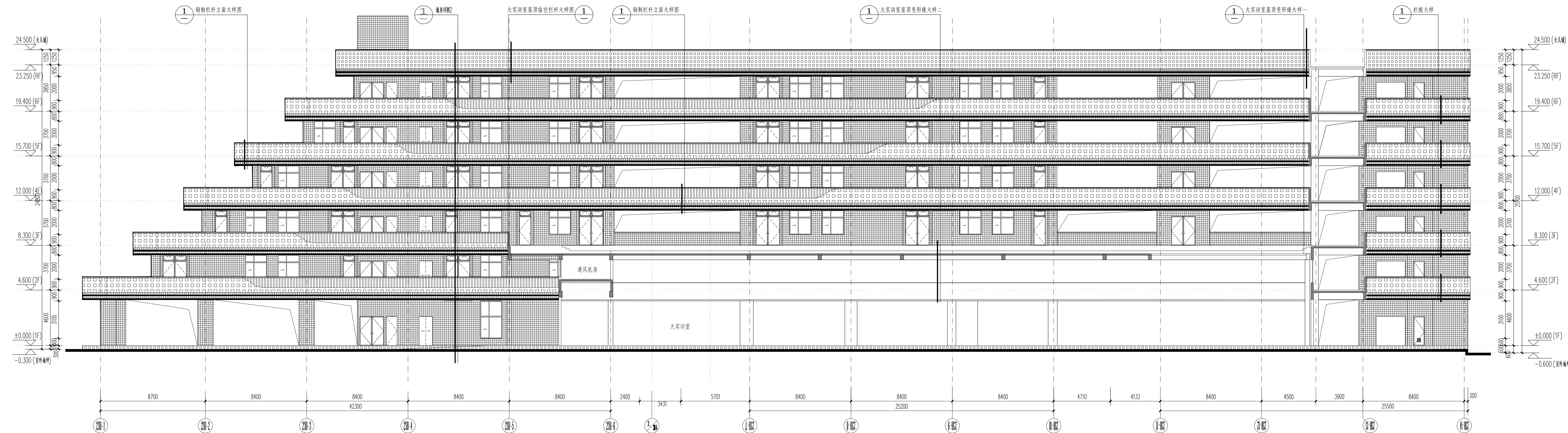
02 23B-1~23B-15轴立面图 SCALE 1:150